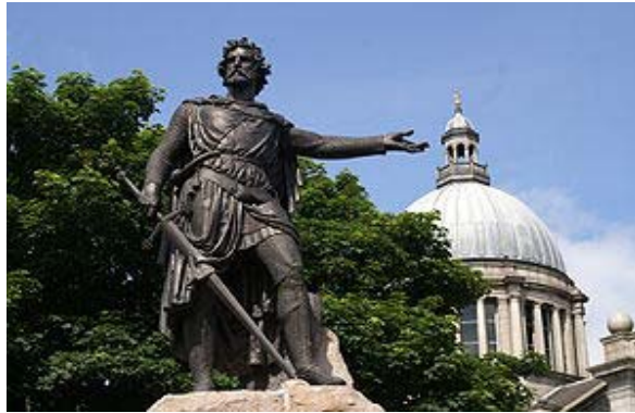
Una statua che raffigura William Wallace, Aberdeen, Scozia

Basato in parte sulla morte del padre per mano loro, avvenuta nel 1291, Wallace vendicò ulteriormente la perdita del padre vincendo battaglie a Loudoun Hill (nei pressi di Darvel, Ayrshire) e ad Ayr.